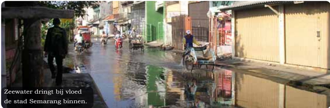
Zeewater dringt bij vloed de stad Semarang binnen.