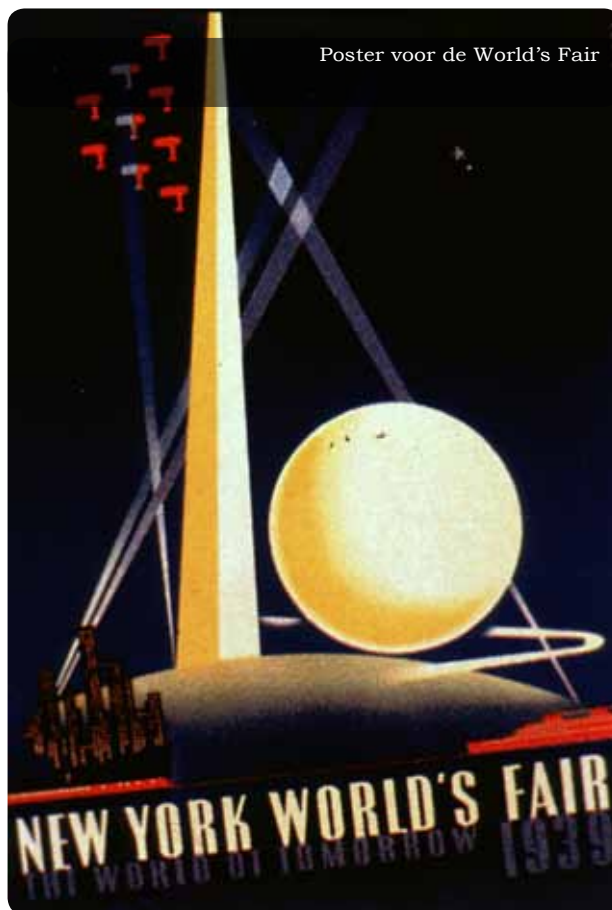
Poster voor de World's Fair

De tentoonstellingen, waar van alles te zien was; van kunst tot de nieuwste snufjes uit de wetenschap, waren een idee van Prins Albert van Engeland. De groeiende industrie en de zoektocht naar nieuwe afzetgebieden zorgden ervoor dat het nodig was om er een grootschalig internationaal evenement van te maken. Vele landen werkten samen om te bouwen aan een optimistisch beeld van de toekomst.