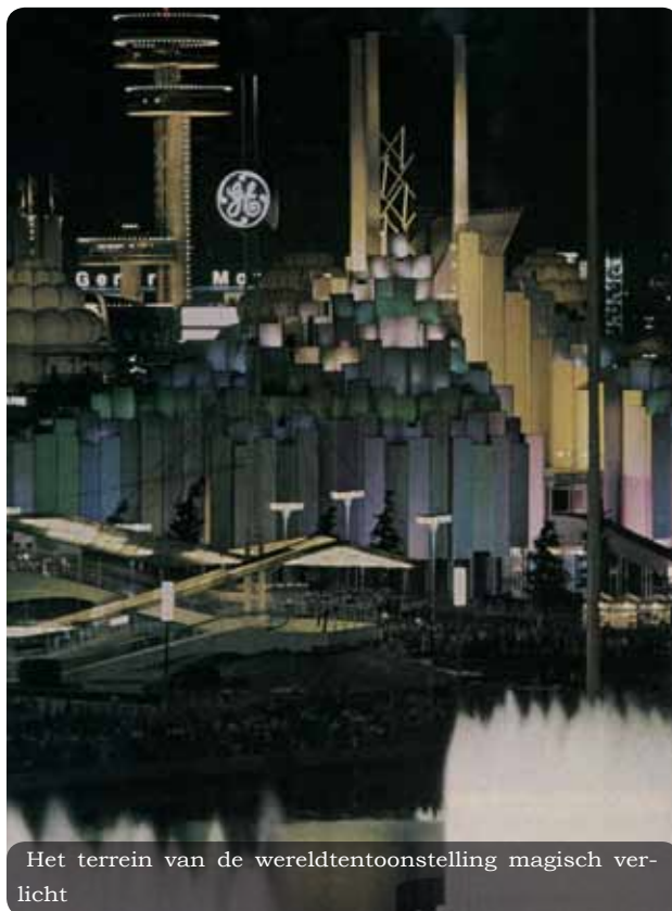
Het terrein van de werelddentoonstelling magisch verlicht

Het Utopia zoals de mensen uit de jaren '30 het voor zich zagen is dus niet helemaal in detail uitgekomen. Maar de positieve en creatieve manier waarop zij de toekomst zagen, kan voor ons als voorbeeld dienen.